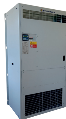
L'immagine sopra riportata è puramente a titolo indicativo The image above is purely indicative

I monoblocco vengono forniti con il pannello interfaccia utente a bordo macchina per la gestione di comando e controllo, completo di sezionatori con protezioni elettriche interne per sovracorrenti.