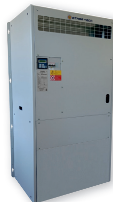
L'immagine sopra riportata è puramente a titolo indicativo The image above is purely indicative

POTENZA FRIGORIFERA DA 2,0 A 13,9kW Cooling capacity from 2,0 to 13,9kW