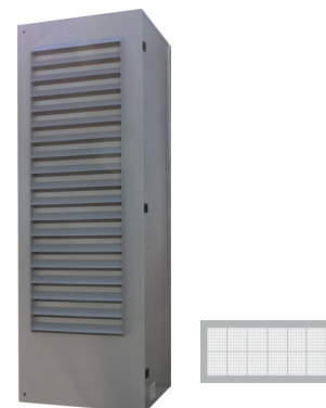
L'immagine sopra riportata è puramente a titolo indicativo The image above is purely indicative

The system of air INTRODUCTION with "Settling Chamber" has the characteristic of guaranteeing continuous air changes with the primary objective of transferring the heat generated by the equipment to the external environment (for dissipation).