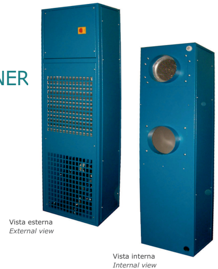
Vista esterna External view

POTENZA FRIGORIFERA DA 2,7 A 4,5kW Cooling capacity from 2,7 to 4,5kW