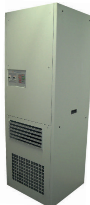
Monoblocco da interno Indoor Packaged air conditioning unit

La linea di condizionatori ad Inverter da interno comprende potenze frigorifere da 2/8 Kw e 3/10 Kw con alimentazione sia monofase che trifase.