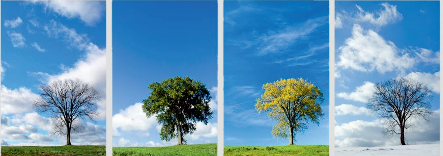
Made to get the ideal CLIMATE for any season